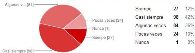
¿Al conectarte a internet, dedicas suficiente tiempo a la investigación de tu área académica?

Finalmente, un gran número de estudiantes respondieron dedicar suficiente tiempo a la investigación, ya sea para sus clases o para sus trabajos de investigación, en especial para su trabajo recepcional. Al inicio de su carrera, los alumnos toman una clase de investigación donde tienen su primer contacto con proyectos, por lo que competencias de búsqueda, selección, clasificación y