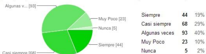
¿Manejas aplicaciones en línea de acuerdo a tu carrera (Traductores online, Diccionarios online... etc)?

En cuanto al aprendizaje de lenguas los estudiantes respondieron que algunas veces utilizan