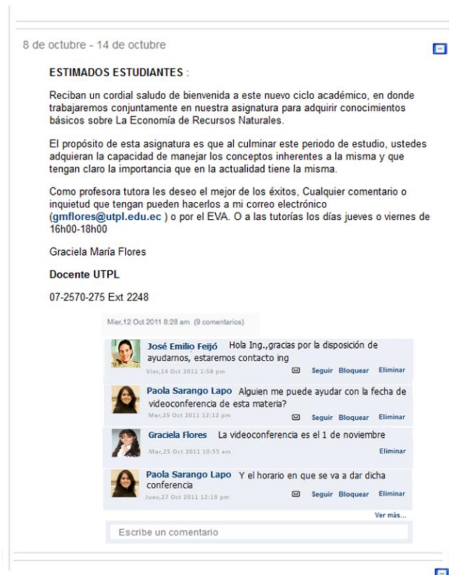
Figura 3. Vista del formato comentarios por tema